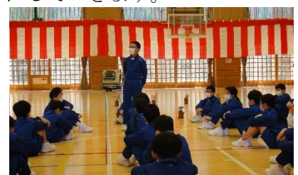
入学式の会場準備について振り返る様子

学校再開後には、子供たちが安心して学校生活を送れるよう、より一層児童理解に努め、みんなで気持ちのよい学校をつくっていきたくと考えています。