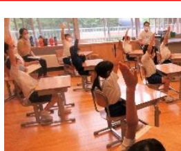
手を挙げる子供の姿

子供たちが学校探検で見つけた気付きを「ひみつ」と題し、友達に伝えようと投げかけたことで、子供たちは意欲的に自分の考えを発表したり、興味をもって友達の話に耳を傾けたりすることができました。