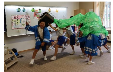
<盛り上がったとちのみ獅子舞>

次は、「とちのみ獅子舞」を企画したとちのみ学級の子供たちです。獅子舞は、「悪いものを追い払ってみんなを元気にする」と知り、自作の獅子舞でみんなを元気にしたいと考えました。子供たちは張り切って準備や練習を進め、17日と18日の2日間にわたって全校の前で披露しました。太鼓や笛等の演奏を自分たちで行い、獅子頭や目録、提灯等も作り、雰囲気たっぷりに元気に踊る獅子舞を見て、みんなの笑顔がはじけます。飛び入り参加の子供たちもいて、元気パワーいっぱいのひとつときになりました。