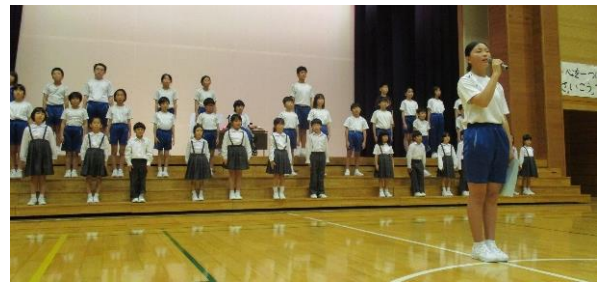
<感謝の心を挨拶に表している子供たち>

小中学校の保護者代表と教員代表で構成された「 教育課程検討部会 」では、新しい義務教育学校の校訓や学校教育目標、特色について協議しています。1年生から9年生までの9年間で目指す姿を思い浮かべ、そのためにどんな特色のある学校を創っていけばよいかについて話し合っています。今後は、学校行事や全校活動、日課運行等、細部まで計画を立てることになります。五箇山の風土に合った魅力的な学校を目指します。